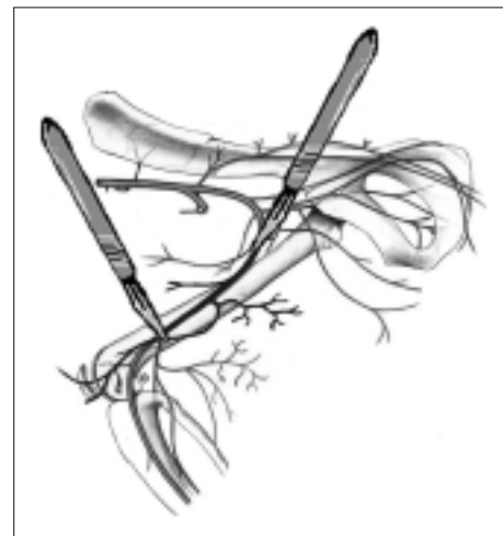
Figura 3. Dissezione dell'arteria femorale e dei relativi rami. L'arteria femorale ed i suoi rami principali (arteria circonflessa femorale laterale, arteria femorale caudale laterale e arteria epigastrica caudale superficiale) sono state dissecate, legate ed asportate nel loro intero tragitto.

l'esame istologico documentava negli animali trattati con plasmide-VEGF 165 un rapporto fra capillari e miociti notevolmente più elevato rispetto agli animali di controllo. Anche i plasmidi contenenti DNA complementare per VEGF 121 , VEGF 165 e VEGF 189 hanno mostrato una simile attività biologica nell'indurre angiogenesi 59 . Risultati analoghi sono stati ottenuti mediante somministrazione intramuscolare diretta, anziché in-