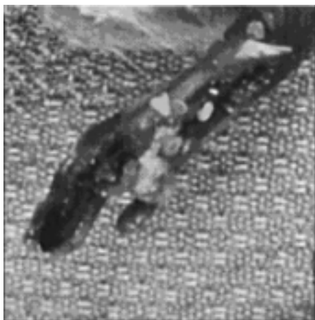
Figura 4. Gangrena di arto inferiore di ratto 5-7 giorni dopo la somministrazione intrarteriosa di gene con carrier adenovirale in arto ischemico. Da Messina et al. 81 , con il permesso dell'Editore.

La forma basica dell'FGF è stata sperimentata da vari autori 86-93 mediante varie modalità di somministrazione, incluse forme di rilascio lento controllato 66 . È però da segnalare che l'incremento di flusso ottenuto negli animali trattati rispetto ai gruppi di controllo mostrava un limite temporale, essendo il fattore evidenziabile per non più di 3 settimane. Altri hanno utilizzato il gene codificante per FGF o bFGF trasportato da un