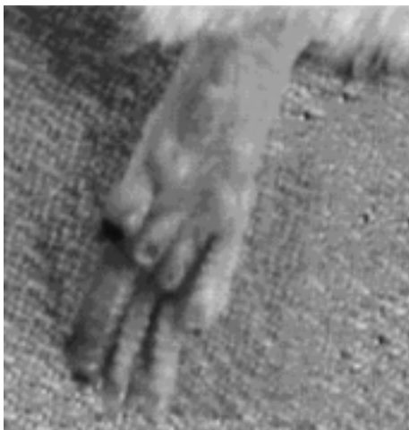
Figura 5. Prevenzione della gangrena mediante somministrazione di ciclosporina. Da Messina et al. 81 , con il permesso dell'Editore.

adenovirus (Ad-bFGF) dimostrando la formazione di una nuova rete vascolare locale 67,94,95 .